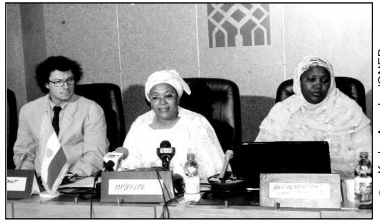
Une vue de la table de séance

mesures et mécanismes à mettre en œuvre pour promouvoir une représentation accrue des femmes. La promotion de la femme occupe une place importante au sein des objectifs du millénaire pour le développement. Ces objectifs sont approuvés par les nations du monde entier et appellent au renforcement de l'égalité entre les sexes et du pouvoir d'action des femmes". Par ailleurs, la participation des femmes à la prise des décisions ne se limite pas à la seule considération de justice et de démocratie. C'est aussi une condition nécessaire pour que les besoins et les aspirations de l'ensemble de la population soient pleinement pris en compte. Promouvoir la participation des femmes en politique est reconnue comme une nécessité pour tout fonctionnement politique équilibré, soucieux des besoins et intérêts de toutes les composantes d'une société. Cela nécessite de lever progressivement les obstacles qui persistent encore et freinent la pleine participation des femmes à la prise de décisions et à la vie politique. Pour cela, a-t-elle ajouté « il nous paraît judicieux d'examiner la possibilité de s'engager dans