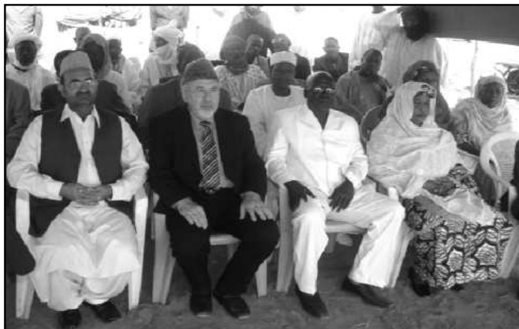
Une vue des personnalités à la cérémonie de pose de la première pierre

mosquées, aides en nature au profit des populations nécessiteuses, école de couture pour femmes, ouverture d'une école primaire, réhabilitation de plusieurs forages, pour ne citer que cela. Tout récemment, le mercredi 27 avril 2011, la Jama'at Islamique Ahmadiyya Niger avait procédé à la