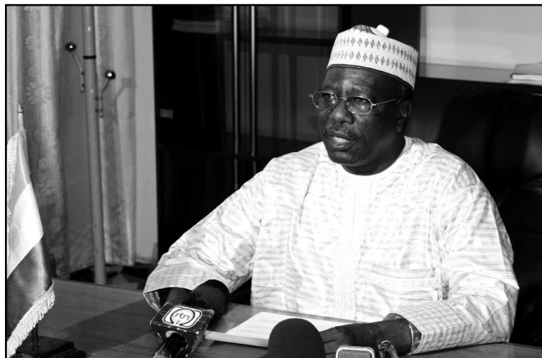
Le ministre Salifou Labo Bouché prononçant son message, hier

l'appel à l'action de l'UIT à l'occasion de la présente Journée mondiale des télécommunications et de la Société de l'Information », a dit le ministre. A l'occasion de la célébration de cette Journée, le Ministère de la Communication, des Nouvelles Technologies de l'Information, chargé des Relations avec les Institutions, organise aujourd'hui en collaboration avec tous les acteurs du secteur (Autorité de Régulation Multisectorielle, Haut Commissariat à l'Informatique et aux NTIC, opérateurs et associations de promotion des Nouvelles Technologies de l'Information) des activités et manifestations. La Commune rurale de Karma, située dans la région de Tillabéri, a été retenue pour accueillir le lancement officiel de ces activités et manifestations. « Il sera fait état par les opérateurs de leurs dernières innovations en terme de produits, services et solutions tech-