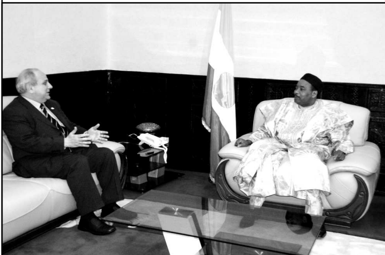
Le Chef de l'Etat avec le responsable des Relations internationales de la Communauté Sant'Egidio